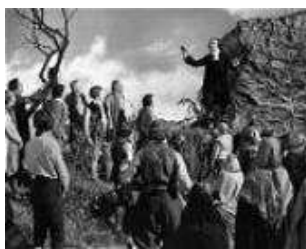
Den Menschen wurde die frohe Botschaft der Erlösung gebracht.

Während sich John und Charles Wesley in den USA aufhielten (1735 bis 1738), wurde George Whitefield zum Erweckungsprediger. Mit seinen Predigten erreichte er eine sehr grosse Anzahl von Menschen, die das Evangelium annahmen. Die erste Versammlung im Freien fand am 17. Februar 1739 statt. Es bildeten sich Gemeinschaften in ganz England, Schottland und Irland. Die Leitung dieser Gemeinschaften übernahmen Laienprediger. Verwalter in den Gemeinschaften kümmerten sich um die Finanzen und übernahmen die soziale Arbeit. Neben den