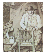
Die ärmlichen Verhältnisse vieler Leute jener Zeit: ein armer Schuster

derts nahm die Verelendung zu. Das Gemeindeland, das alle nutzen konnten, wurde eingezogen und privatisiert und so der Nutzung durch die Allgemeinheit entzogen. Zudem begann die Industrialisierung; Industrieprodukte verdrängten weitgehend in Handarbeit gefertigte Produkte, wodurch die Handwerker ihre Verdienstmöglichkeiten verloren. Die Arbeitslosigkeit stieg erheblich.