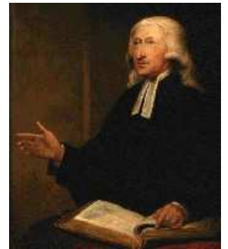
John Wesley (1703–1791)

1784 trat in Baltimore eine Konferenz zusammen (Weihnachtskonferenz), welche die erste amerikanische Kirchenordnung schuf. Die Kirche erhielt den Namen Methodistische Bischöfliche Kirche (Methodist Episcopal Church). Die methodistische Kirche breitete sich von den Südstaaten über Neu-England ins Landesinnere aus. Das Reisepredigersystem war für die Evangelisation sehr geeignet. Oft gründeten Laien eine Gemeinde, dann suchte sie ein Reiseprediger auf. Neben der geistlichen Tätigkeit engagierte sich die Kirche ab 1830 gegen den Alkoholmissbrauch. Wo öffentliche Schulen fehlten, sorgte unter anderem die methodistische Kirche für Schulen.