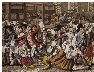
Wirtschaftskrise im 18. Jahrhundert in England: Alle wollten lieber Gold statt Papiergeld

Die Religion hatte für die Oberschicht nur wenig Bedeutung. Das Christentum war eine äusserlich gepflegte Sitte. Der Zustand der anglikanischen Kirche war schlecht. Viele der Kleriker bezogen zwar aus ihren Pfarrgemeinden die ihnen zustehenden Kirchensteuern, sie hielten aber keine Gottesdienste und keine Abendmahlsfeiern ab. Allenfalls überliessen sie die Arbeit in der Gemeinde schlecht bezahlten Hilfsgeistlichen. In vielen Kirchengemeinden fanden aber überhaupt keine Gottesdienste oder Abendmahlsfeiern statt. Die Unwissenheit über die Religion war deshalb in der Unterschicht weitverbreitet.