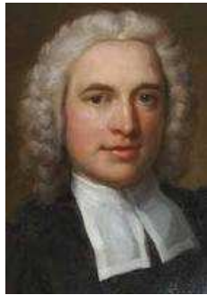
Charles Wesley (1707–1788)

Lokalpfarrern setzte John Wesley auch sogenannte Reiseprediger ein, die an verschiedenen Orten eingesetzt wurden. Zum Erfolg der Evangelisation trugen auch die neu geschaffenen Lieder bei. Charles Wesley hat ungefähr 6500 (!) Lieder gedichtet. Als Melodien verwendete er teilweise Gassenhauer.