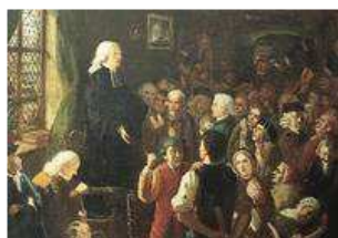
John Wesley als Prediger